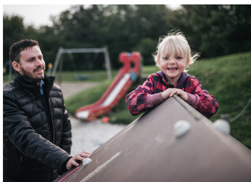
En tur på legepladsen er altid populær.

„Brejning tiltrækker mange tilflyttere, og vi er selv blevet mødt af et meget åbent miljø. Det er naturligt at tage imod hinanden og falde i snak, byen har en god størrelse og her er et rigt foreningsliv. Som børnefamilie er fælleslegepladsen helt genial og et godt sted at mødes i weekenden. Mange forelsker sig i strandene, skovene og de smukke, historiske bygninger. Men her er også en rigtig fin infrastruktur med togforbindelse direkte til storbyerne“.