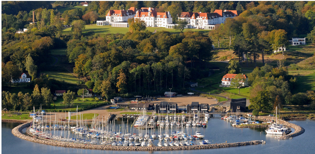
Brejning lystbådehavn med Hotel Kellers Park i baggrunden.