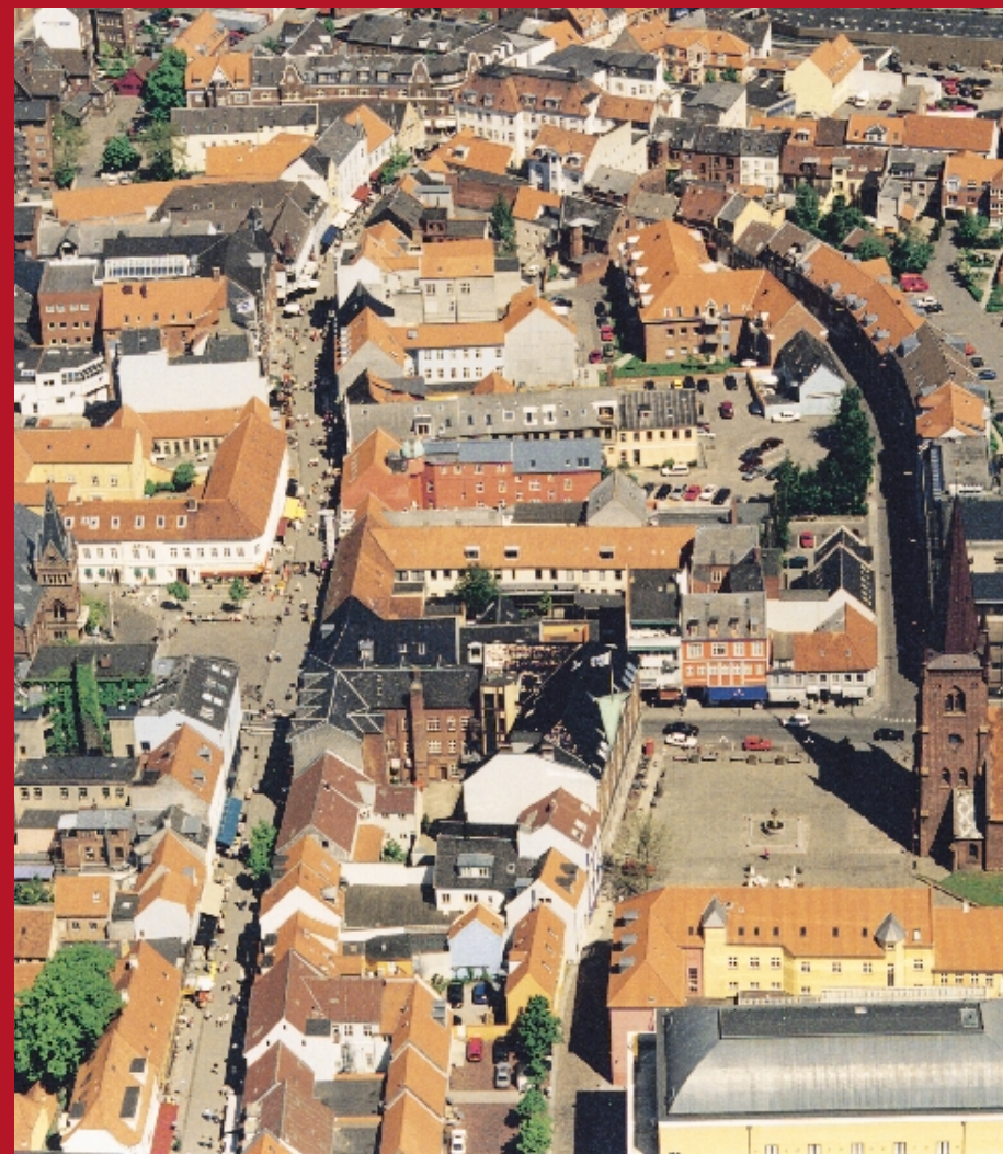
Vedtaget af Byrådet d. 6. maj 1997

Byrådet vil derfor præsentere en arkitekturpolitik, der giver nogle overordnede målsætninger for Vejle. De vil blive fulgt op af konkrete initiativer i en handlingsplan med udgangspunkt i det arbejde, der allerede sker inden for forskellige dele af kommunen. Samtidig er politikken en opfordring til andre offentlige myndigheder og til private bygherrer om at fremme arkitektoniske synspunkter.