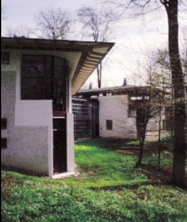
1 Mølholm Sognehus 1992.