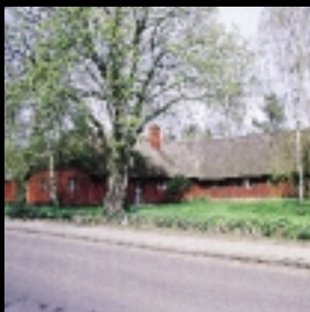
4 Lille Grundet, Naurstræde 1989. Arkitekt Tegnestuen Østjylland.