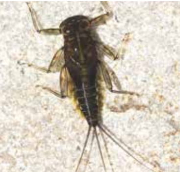
Døgnfluen Rhitrogena germanica .

Svampefloraen er mangfoldig og rummer både sjældne og almindelige arter. Svampen krølhåret pragtbæger, som er meget sjælden i resten af landet, vokser langs Højen Bæk og kan ses sidst på vinteren. Pibet køllesvamp findes i ret stort antal i bøgeskoven i starten af vinteren.