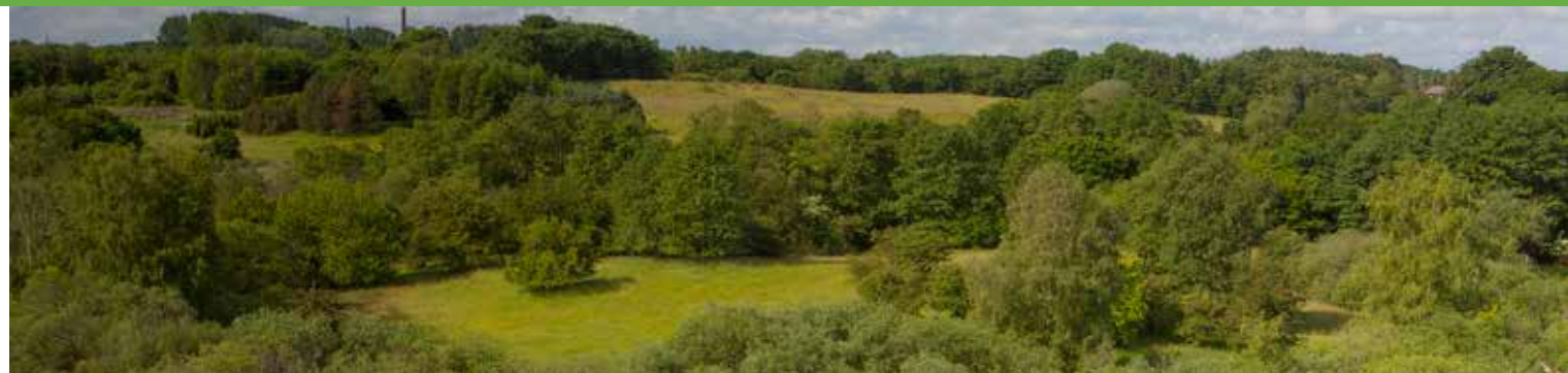
Mølholm Ådal.