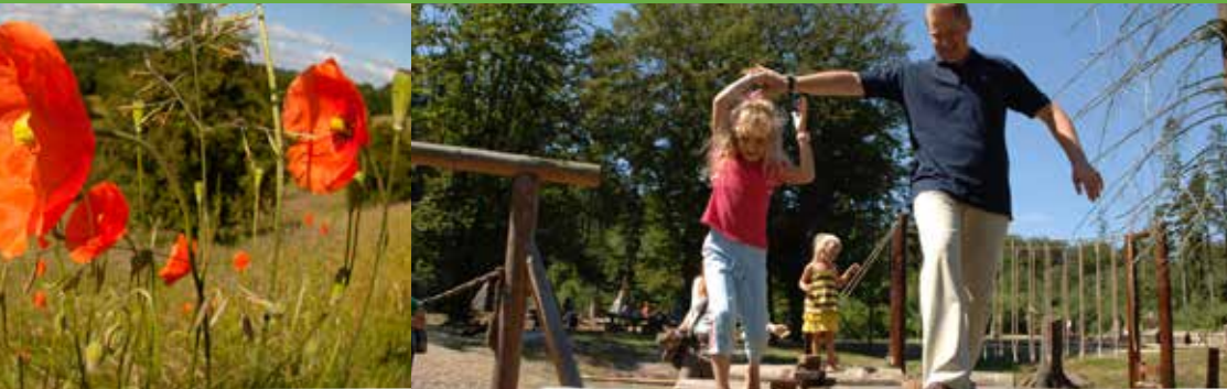
Skovlegepladsen i Sønderskoven.

gul anemone og skælrod. På de lerede skrænter i skoven, og på markerne er også storblomstret kodriver flere steder ret almindelig.