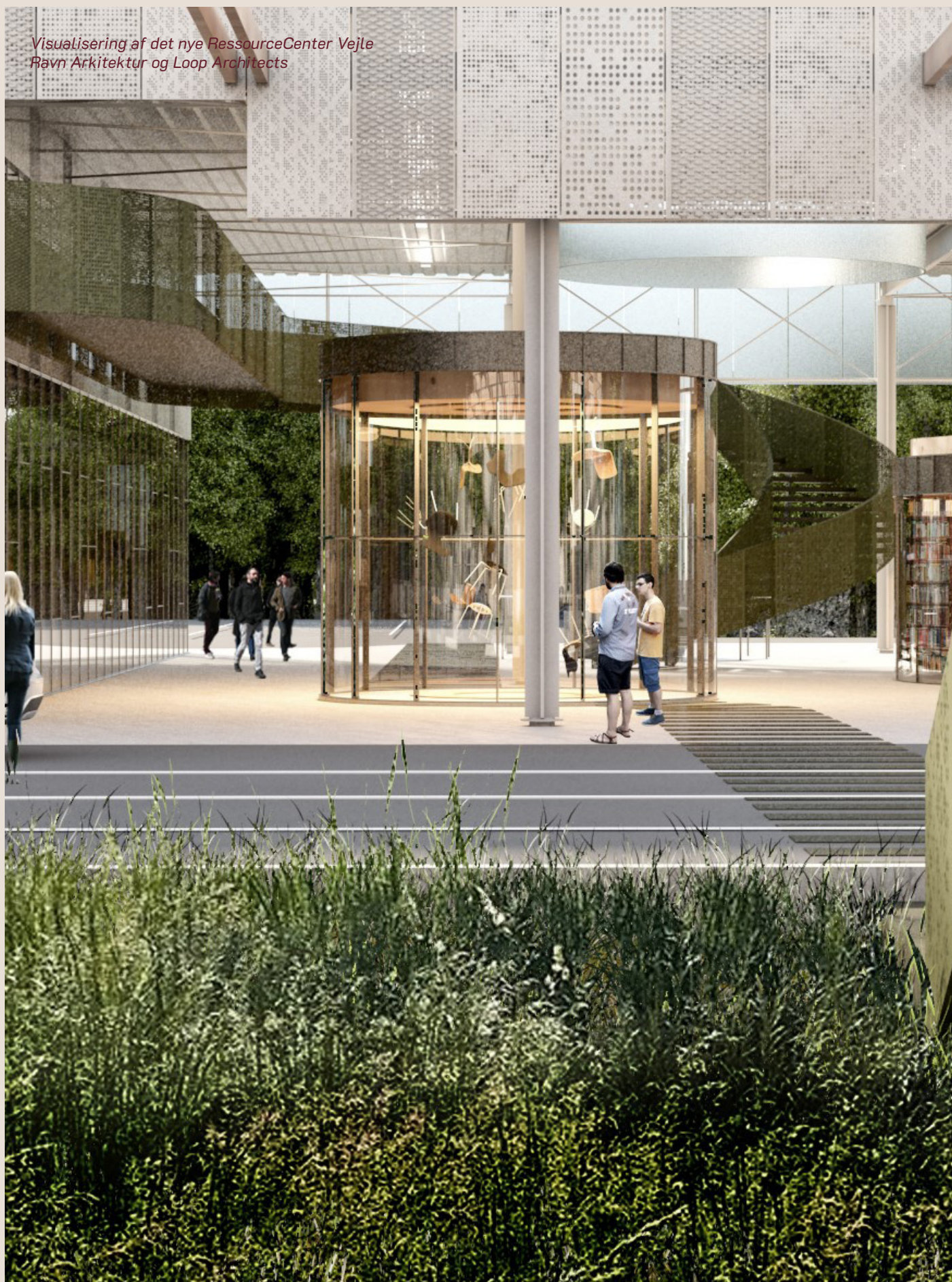
Visualisering af det nye RessourceCenter Vejle Ravn Arkitektur og Loop Architects