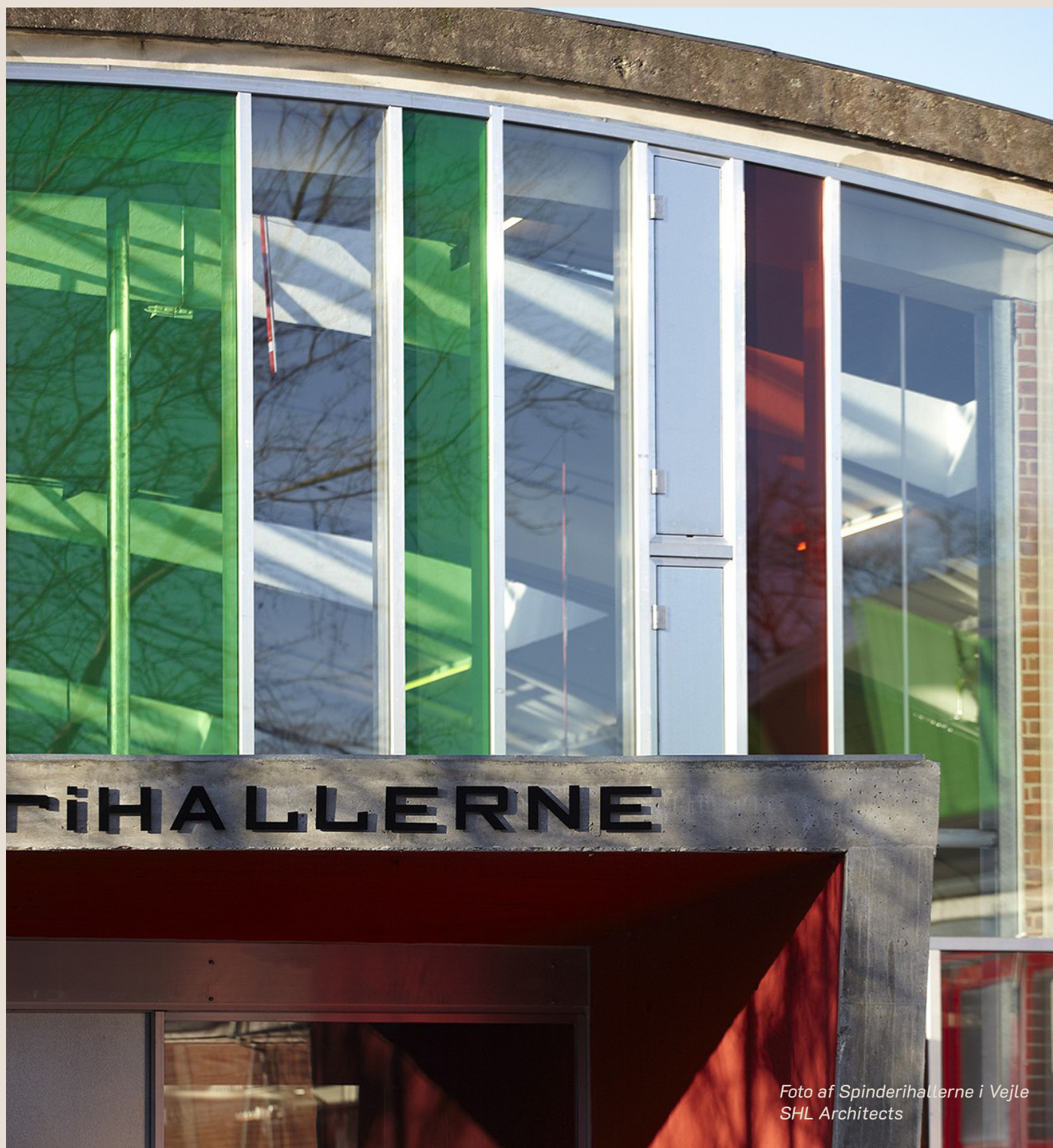
Foto af Spinderihallerne i Vejle

Strategi for bæredygtigt byggeri er udarbejdet i 2021/2022 af Kommunale Ejendomme, Teknik & Miljø, Vejle Kommune